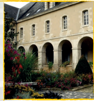
Jardin du Cloître de Mamers