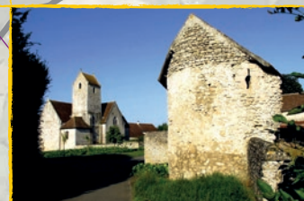
L'église de Vezot