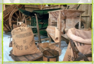
Maison du Chanvre et de la Ruralité à Saint Rémy du Val